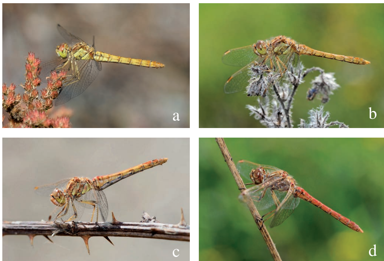
Figura 1. Sympetrum vulgatum ibericum . a) Femella immadura. b) Mascle immadur c) Femella madura. d) Mascle madur. Cerdanya (Girona). Autor: Adrià Miralles Nuñez.

ons de les quals es disposa d'informació completa i detallada, i que han pogut ser confirmades, ja sigui a partir de fotografies, per la fiabilitat i experiència de l'observador o bé contrastant la identificació amb els autors. A més, també s'han verificat totes les observacions recopilades pel Grup d'Estudi d'Odonats de Catalunya (Oxygastra-GEOC) que van ser incloses en el llibre Les Libèl·lules de Catalunya (Martín et al. 2016). No s'han tingut en compte els registres antics de l'espècie de finals del segle XIX i principis del XX, ja que no es pot descartar que siguin identificacions errònies i confusions amb altres espècies (Martín, 2004). Aquests registres dubtosos ja no es van tenir en compte a Martín et al. (2016).