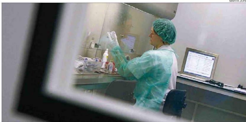
►► Un laboratori d'investigació a Barcelona.